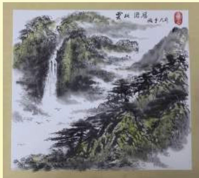
孔宪玉《云山固居》绘画类第三名